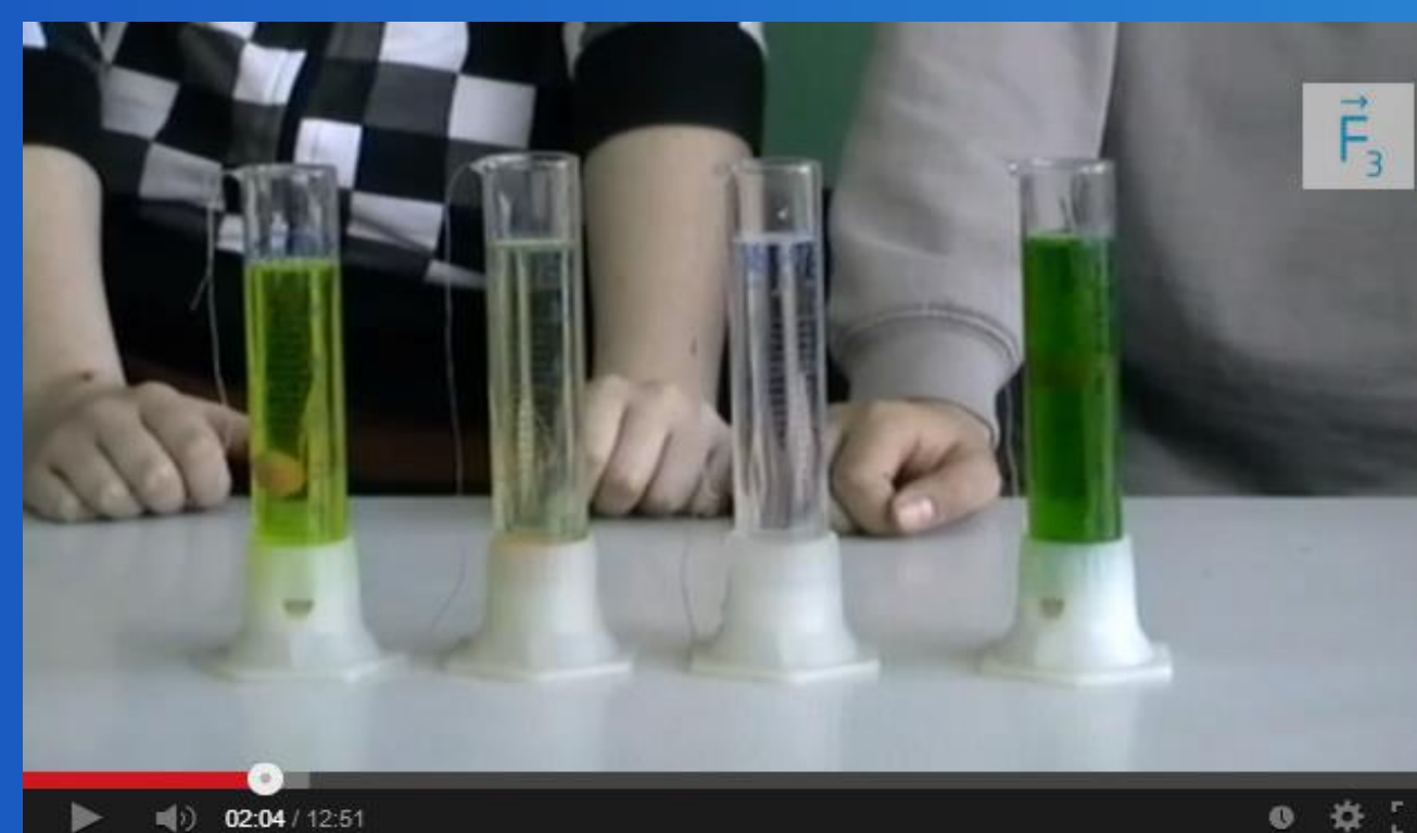
Hustota kvapalín – Základná škola