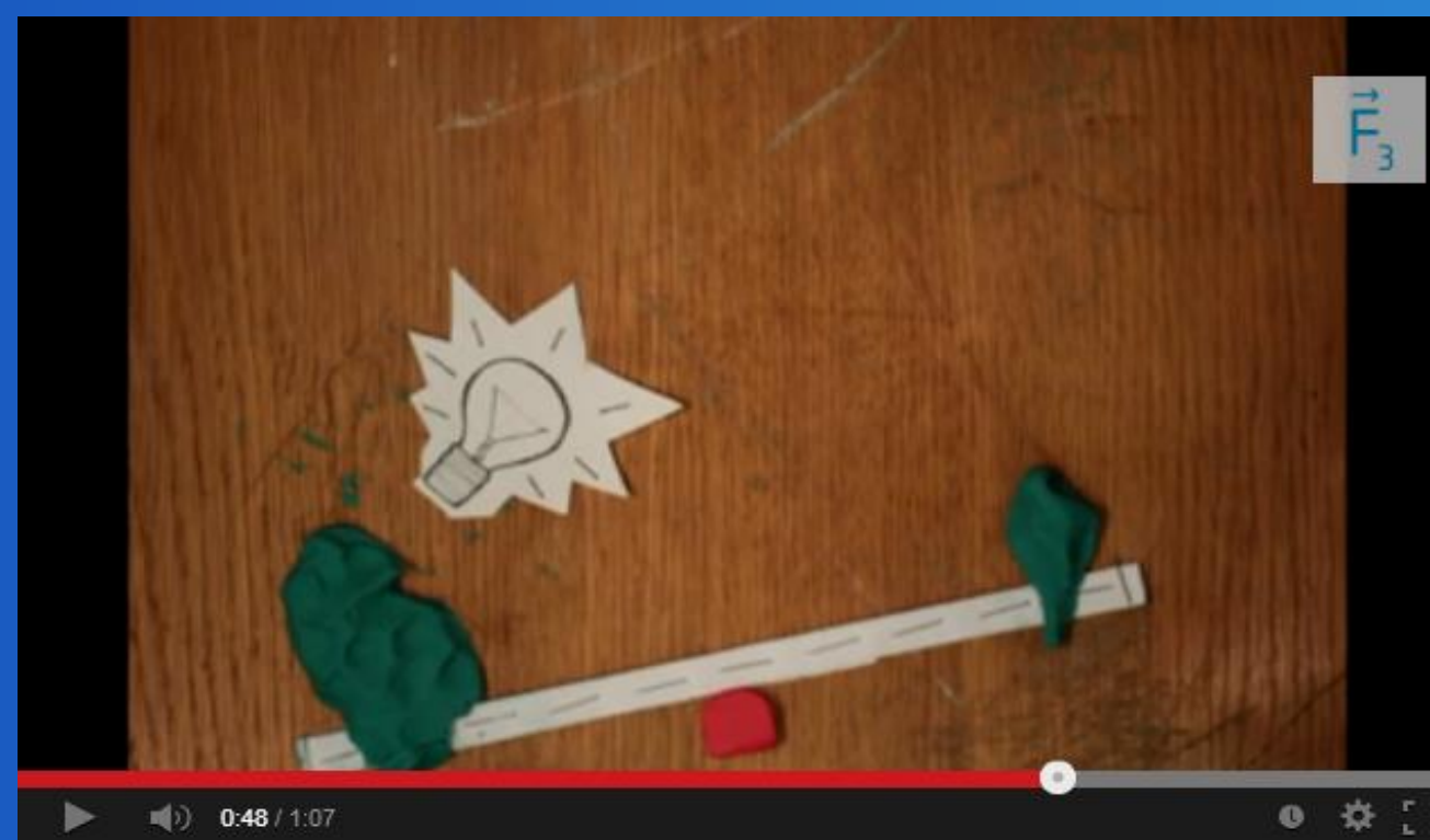
Hojdačka – Krátky film